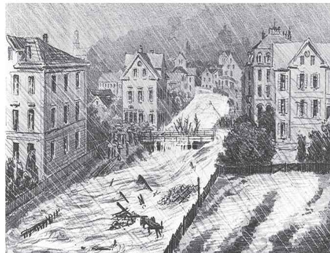
Bild 3. Zürcher Hochwasser 1878, an der Seefeldstrasse.

erkannt und mit geeigneten Vorkehrungen minimiert werden. Alarmierung und Evakuierung, Objektschutz sowie Versicherungen zur Deckung von Schäden sind zentrale Elemente im Umgang mit Restrisiken.