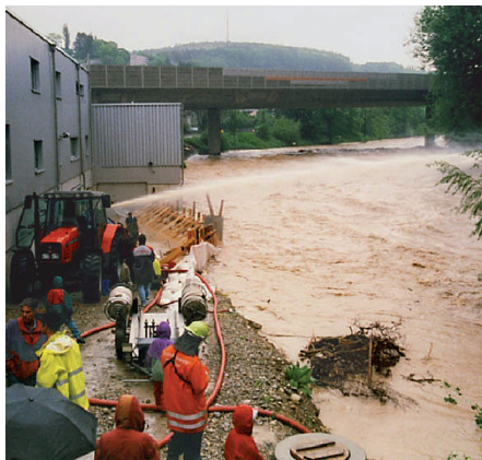
Bild 1. Die Töss mit Hochwasser.

Ein vollständiger Schutz gegen Hochwasser ist nicht möglich. Seltene Grossereignisse führen zu einer Überlastung der für ein bestimmtes Schutzziel ausgelegten technisch-präventiven Massnahmen. Die damit verbundenen Restrisiken müssen