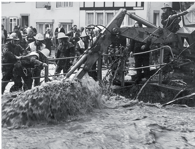
Bild 2. Die Feuerwehr von Lufingen im Einsatz.