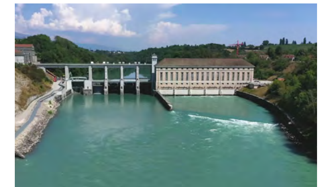
Foto: Barrage de Chancy-Pougny, SIG.